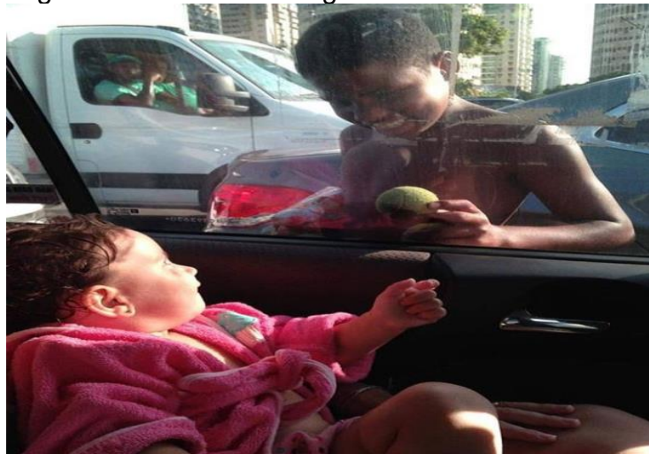
Figura 1 – Infâncias desiguais

Descrição da imagem: Uma bebê branca em uma cadeirinha no banco de trás de um carro, sorrindo para outra criança negra que brinca com ela pela janela do veículo.